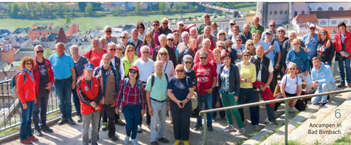
Fotos: Cover: Farnhöggl, Farnhöggl, Gantajo, Kraus, Huss, ÖCC, Adobe, Wehrent