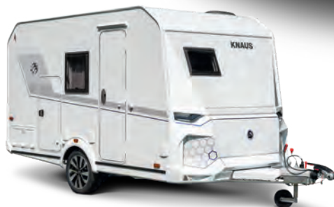
42 Knaus Yaseo 340 PX.