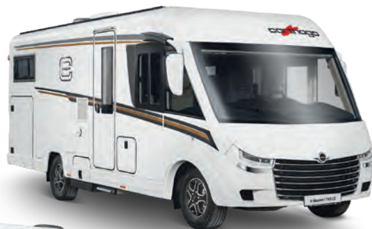
40 Carthago C-Tourer I 145 RB LE Superior.