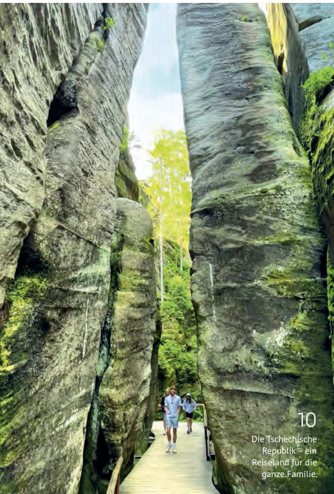
10 Die Tschechische Republik – ein Reiseland für die ganze Familie.